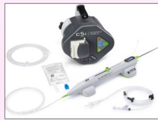
ダイヤモンドバック