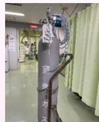
このガスでダイヤモンドバーを高速回転（およそ分速19万回転）させます。

血管の壁には、様々な動脈硬化性物質が長年にわたり付着し、血液の流れを悪くしてしまいます。通常のパルーン（風船）や金属ステントでは、十分に治療できないことがありましたが、従来より利用されている「ロータブレーター」や、近年日本においても使用可能になった「ダイヤモンドバック」といった最新器具は、先端にダイヤモンドチップがついた器具を用いて、血管の硬いところを削る治療が可能な器具です。