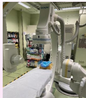
心カテ台 ここに横になっていただきます。

私たちはカテーテルと呼ばれる管を用いて、日夜この病気の発見と治療に取り組んでいます。外科手術が必要な場合は心臓血管外科の先生にお願いするのですが、カテーテルを用いて、この病気を発見するだけでなく、治療まで行える場合もあります。心臓カテーテル治療とは、「血液の流れが悪くなった血管の掃除」をする治療であると言えます。