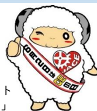
日本臨床工学技士会マスコット「シープリン」

病院の中では人数も少なく、皆さんに会う機会の少ない私たちではありますが、医療機器を使用される患者さん方の事を考えながら、日々仕事に励んでいる人たちがいるという事を覚えていてもらえたら嬉しいです。